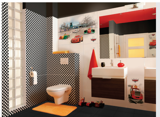
Lightning McQueen und seine Cars-Freunde sind der Renner in diesem Bad.

Düsseldorf, Mai 2016 - (fpr) Mit dem Erwerb einer exklusiven Disney-Lizenz erweitert der spanische Fliesenhersteller Azteca sein Portfolio an keramischen Produkten für Liebhaber von Mickey Maus und Co. Gleich drei Fliesenserien sorgen für die bekannte Disney-Magie im Badezimmer. Der Trend, eigene Waschräume für den Nachwuchs einzurichten, ist nicht neu. Mit seiner Kinderkollektion steuert Azteca nun die Lieblingscharaktere der Kleinen bei.