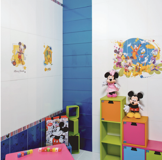
Die Disney-Motive auf den Wandfliesen bringen Spaß und Farbe ins Kinderbadezimmer.

Fliesen lassen sich alle erdenklichen Räume beispielsweise in Kitas, Schulen, Spielzimmern, Einkaufszentren und Arztpraxen farbenfroh und fantasievoll ausstatten. Nahezu grenzenlos lassen sich die Disney-Fliesen dabei mit Uni-Farben kombinieren. Die Dekorfliesen sind so konzipiert, dass man ohne großen Aufwand Mickey, Donald und Lightning McQueen mit der Zeit ersetzen kann. Jeder Profi ist in der Lage, einzelne Fliesen auszutauschen, sobald der Nachwuchs dem Comic-Alter entwachsen ist.