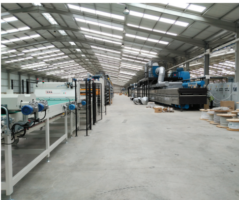
Die neue Produktionsanlage, die Anfang Juni in Betrieb genommen wurde, ist mit der modernsten Technologie ausgestattet.

Die Investition von knapp 30 Millionen Euro wird 50 Arbeitsplätze schaffen. Die energieeffiziente Anlage ist auf dem neuesten technischen Stand und ermöglicht Grespania eine hohe Produktivität. Gut für die Umwelt: Nicht zuletzt werden die Emissionen und die aus dem Fertigungsprozess entstehenden Abfälle stark reduziert.